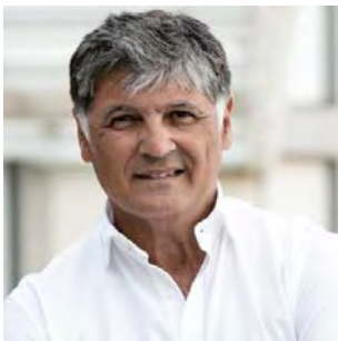
Toni Nadal #63.964

Toni Nadal (Manacor, 1961) forma parte del Consejo Directivo y es experto en gestión de la adversidad, valores y superación. Recibió el Premi Jaume II per su labor de entrenador de Rafel Nadal.